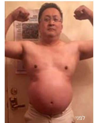
*הצגה: מחקר לקוחות הראה שהמשתתפים בתוכנית Slenderiz ירדו במשקל ירדו בממוצע 5.4 עד 6.8 ק"ג ב- 28 יום. התוצאות עשויות להשתנות, בהתאם לדבקות בתוכנית Slenderiz, אשר כוללת תפריט מגוון והתעמלות.