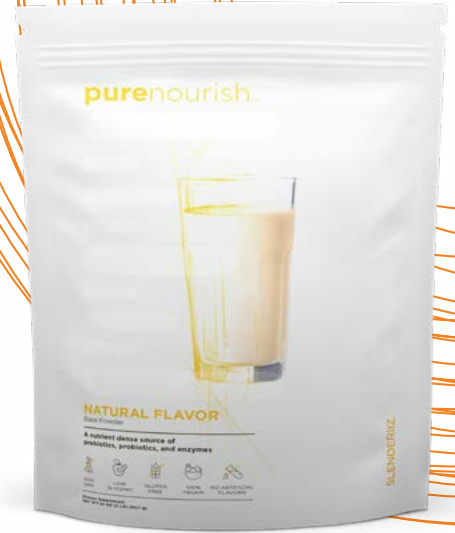
*המוצר נארז בארובה, לא זמין למכירה חוזרת.

לערבב שתי כפות מדידה של PureNourish עם Beauty Boost או Power Boost ו-235 מ"ל (8oz) מים קרים. לנער בחוזקה כדי לערבב. לשייק קרמי יותר, השתמשו בחלב צמחי.