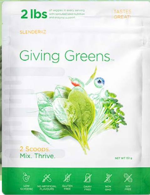
יהמוצר נארו בארה"ב.