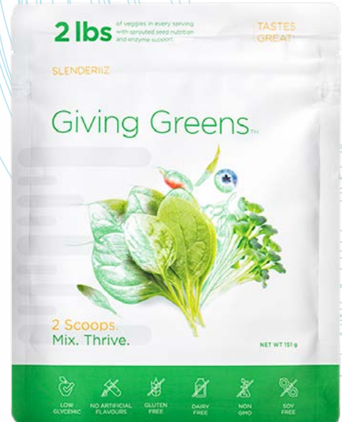
המוצר נטור בארז'יב

Other Ingredients: Gum acacia, Xylitol, Xanthan Gum, Stevia leaf extract, Citric acid and Malic acid.